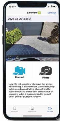
HÁTSÓ KAMERA ÉLŐ NÉZET