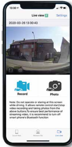
ELSŐ KAMERA ÉLŐ NÉZET