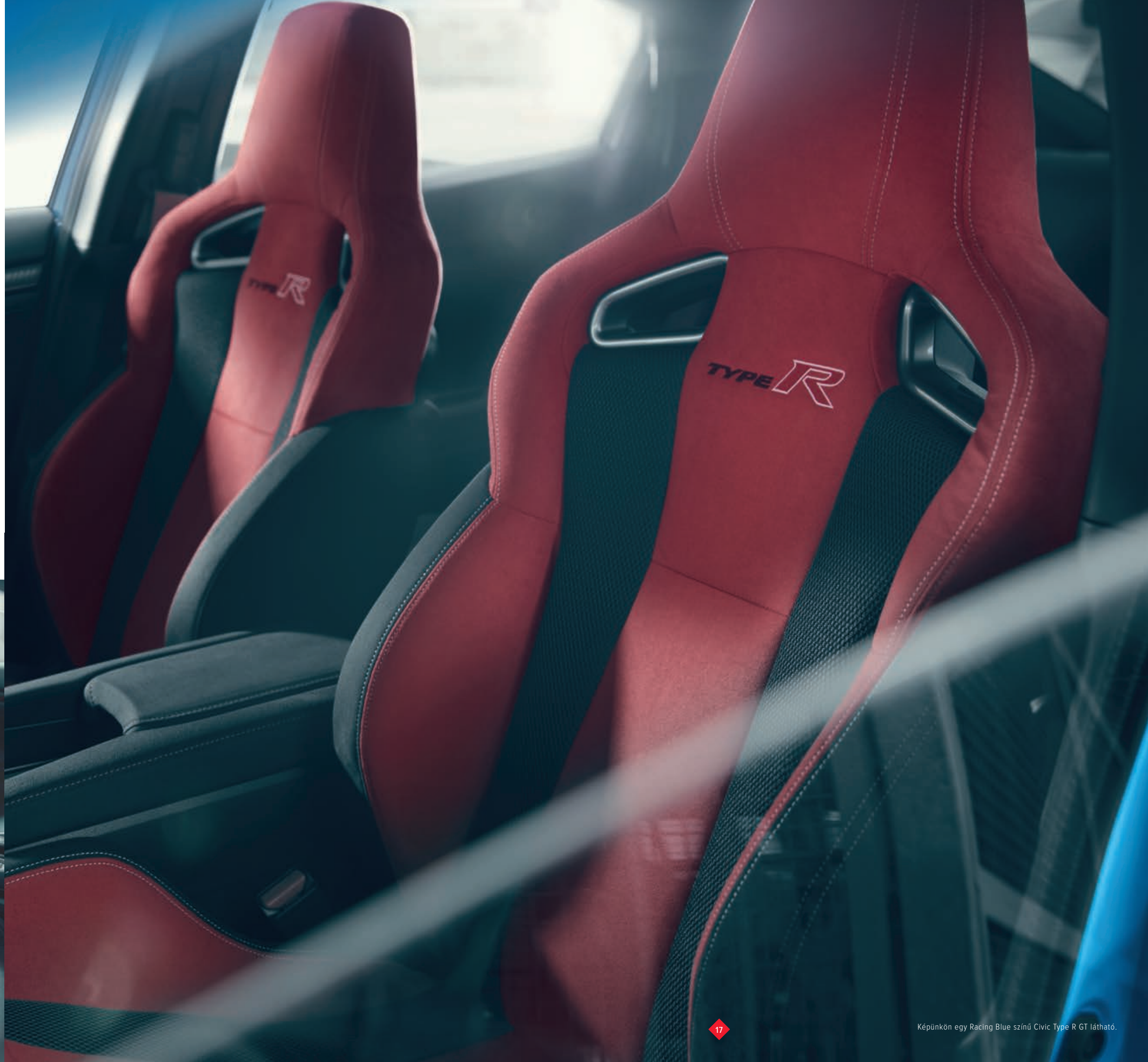
Képünkön egy Racing Blue színű Civic Type R GT látható.