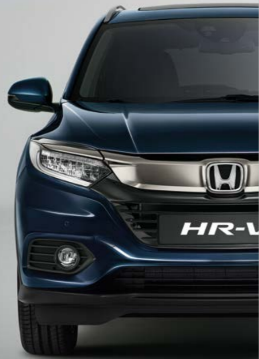
MIDNIGHT BLUE BEAM METALLIC

Színválaszték, ami nem csak jól hangzik, de nagyszerűen is néz ki. A Midnight Blue Beam Metallic-től a Platinum White Pearl-ig, széles választék várja, hogy megtalálja az egyéniségének tökéletesen megfelelőjét.