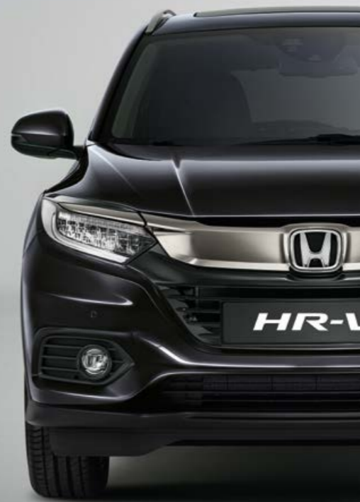
RUSE BLACK METALLIC