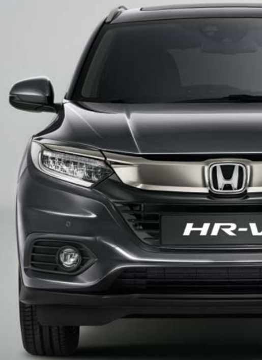
MODERN STEEL METALLIC