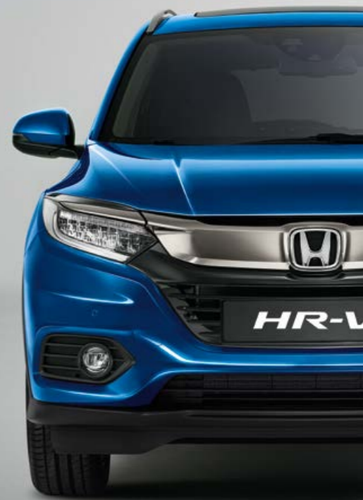
BRILLIANT SPORTY BLUE METALLIC