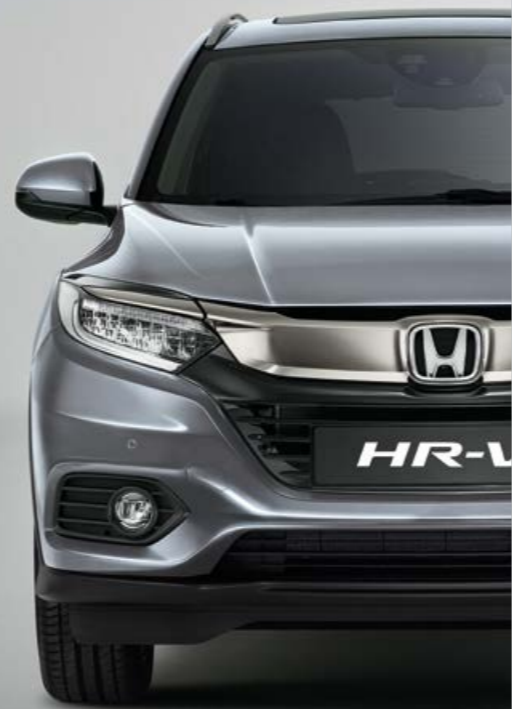
LUNAR SILVER METALLIC