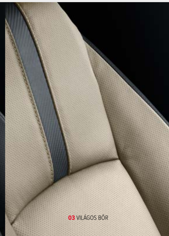
03 VILÁGOS BŐR