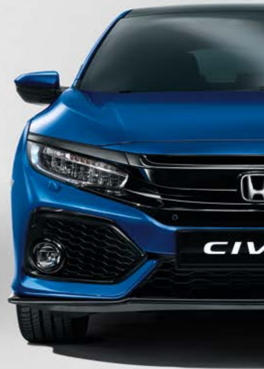
BRILLIANT SPORTY BLUE METALLIC