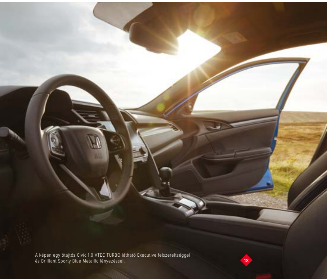
A képen egy ötajtós Civic 1.0 VTEC TURBO látható Executive felszereltséggel és Brilliant Sporty Blue Metallic fényezéssel.

A gondosan formázott, kiváló oldaltartású ülésekben helyet foglalva egyből kiderül, miért oly különleges a Civic beltére. A széles, letisztult műszerfal, a kezelőszervek felhasználóbarát, egyszerű kiosztása, a karosszéria átláthatósága és a páratlan hangulat minden szempontból lenyűgözi a vezetőt. Emellett a lehető leghatékonyabb szigetelőanyagokat és eljárásokat alkalmaztuk, hogy minél békésebb, csendesebb legyen az utastér, Ön pedig a lehető legnagyobb nyugalomban autózhasson.