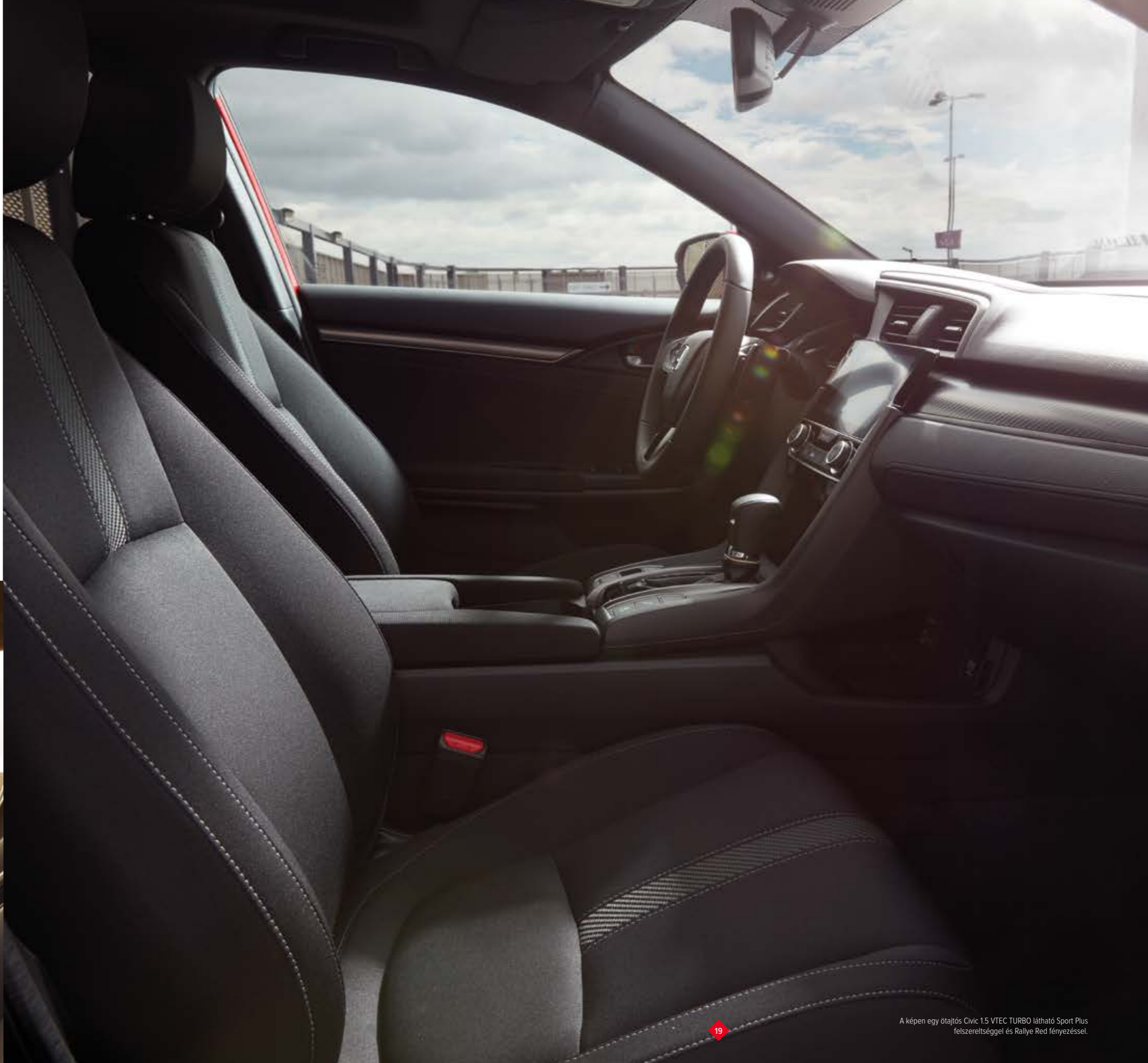
A képen egy ötajtós Civic 1.5 VTEC TURBO látható Sport Plus felszereltséggel és Rallye Red fényezéssel.