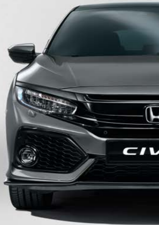
POLISHED METAL METALLIC