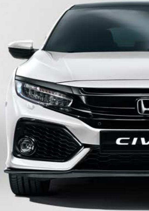
WHITE ORCHID PEARL