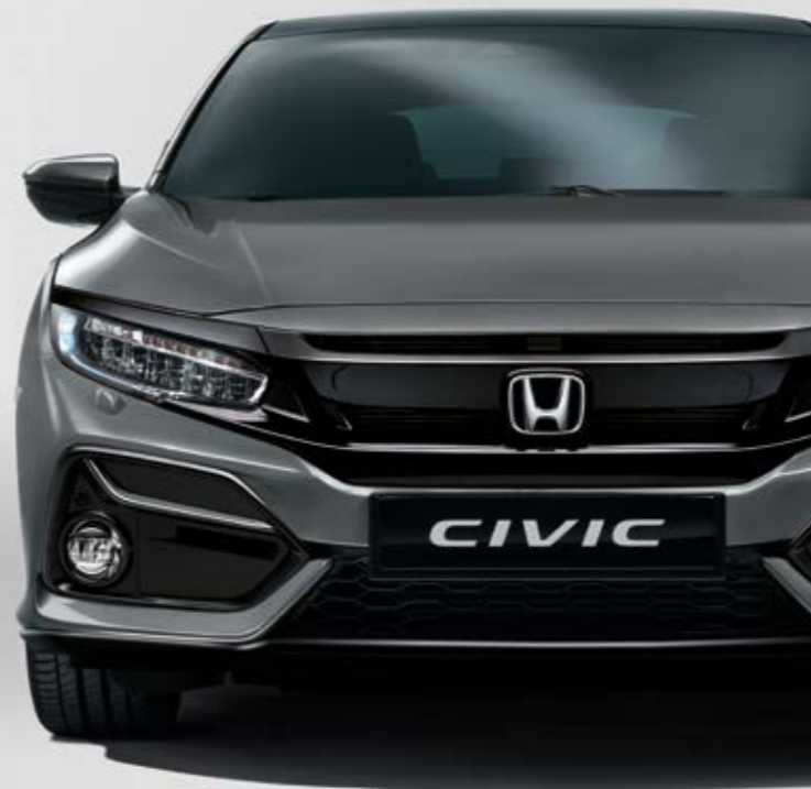
POLISHED METAL METALLIC