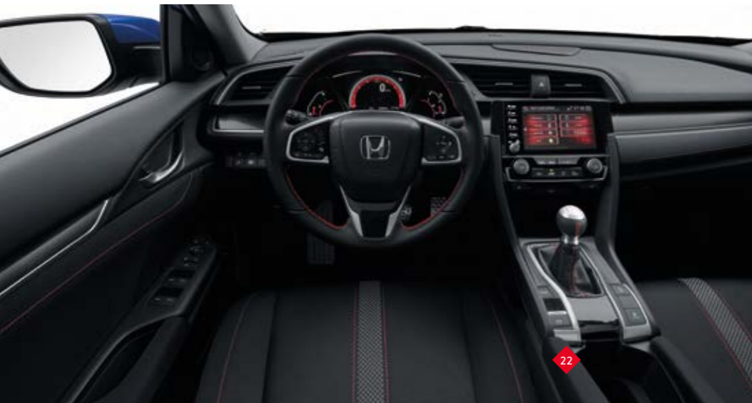
A képeken egy ötajtós Civic 1.0 VTEC TURBO látható Executive Sport Line felszereltséggel és Brilliant Sporty Blue Metallic fényezésessel. Ha kíváncsi a felszereltségi szint részletes leírására, kérjük, lapozzon a 42. oldalra!