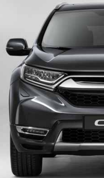
MODERN STEEL METALLIC